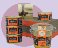
Panier gourmand Biraben

Photos non contractuelles. L'abus d'alcool est dangereux pour la santé, à consommer avec modération. Pour votre santé, évitez de manger trop gras, trop sucré, trop salé et de grignoter entre les repas. www.mangerbouger.fr