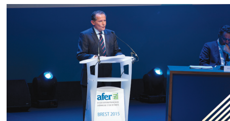
Le Président de l'Afer

Ces investissements seront soit des ajouts soit des substitutions d'investissements plus anciens arrivant à terme. Ils devront être faits avec prudence pour maîtriser les risques progressivement sur les 12 à 18 prochains mois.